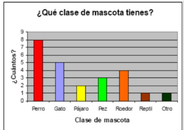
Gráfico de ejemplo

B. Representa en fracción cada clase de animales. Después el porcentaje que hay de cada especie, sabiendo que hay 100 animales en total.