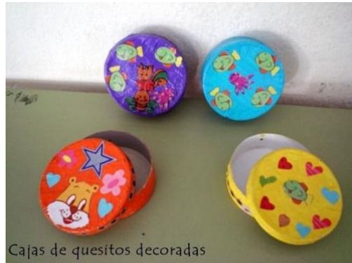
Cajas de quesitos decoradas